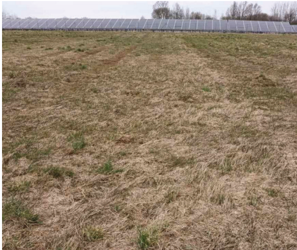
Foto: Ackerbrache mit gemulchter Streuabdeckung – im Hintergrund bestehender PV-Park