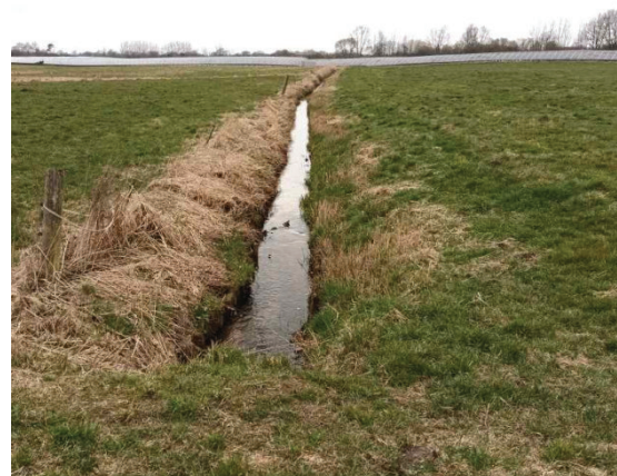
Foto Ende März 2022: Die Dauergrünlandflächen waren im März vollständig abgetrocknet. Im Foto mit querendem Verbandsgraben.