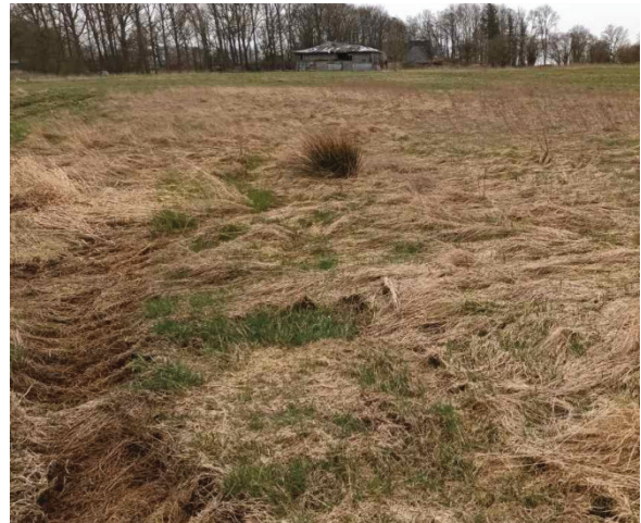
Foto Ende März 2022: feuchte Senke innerhalb der Ackerbrache, die im Vorjahr nur teilweise gemulcht wurde. Etwa bildmitten – einzelne Flatterbinse