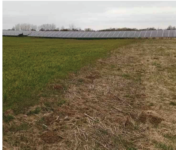
Foto Ende März 2022: Ackerbrache rechts im Foto, links Intensivacker und Bestands-PV-Park im Hintergrund