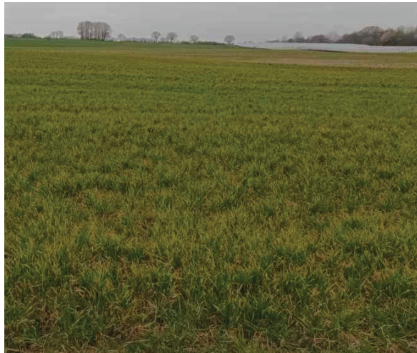
Foto: Intensivackerfläche Ende März 2022 - Blickrichtung Westen mit dem Bestands-PV-Park am Bildrand oben-rechts