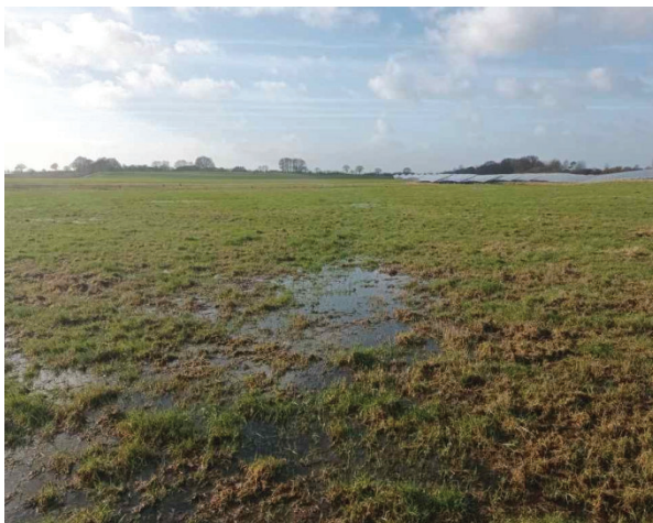
Foto: Das Grünland war im niederschlagsreichen Monat 02.2022 teilweise mit Wasser überstaut.

Dauergrünland weist im Vergleich zu Ackerflächen auf moorigen oder anmoorigen Böden aufgrund der fehlenden oder minimalen Bodenbearbeitung Vorzüge durch einen verlangsamten Vererdungsprozess des Torfes auf. Außerdem können Dauergrünlandflächen für viele Tierarten der offenen Landschaften eine wichtige Funktion übernehmen.